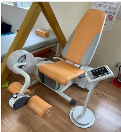
ウェルトニックレッグエクステンション