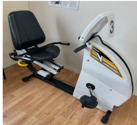
リカレントエアロバイク