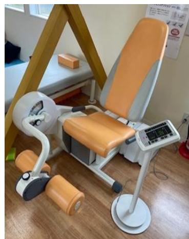
体重支持指数(ウェルトニックレッグエクステンション)