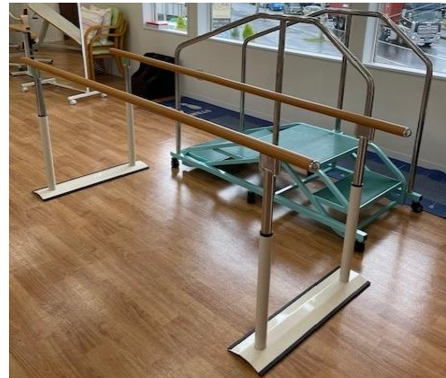
平行棒内・階段運動